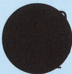
Fachkraft für Lagerlogistik