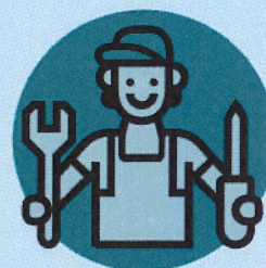
Anlagenmechaniker*in Sanitär-, Heizungs- und Klimatechnik